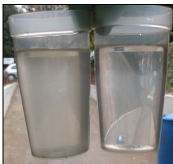
Anti-dépôt de calcaire dans l'eau industriel